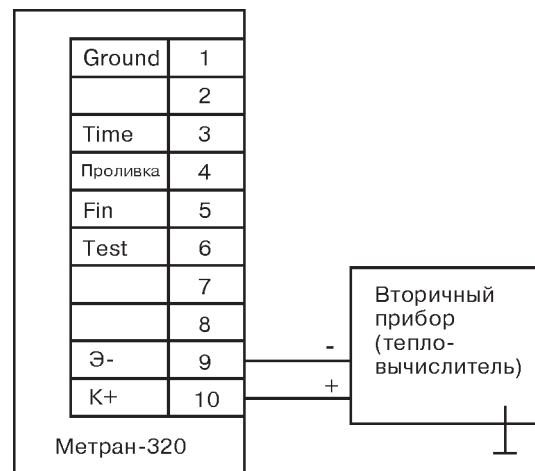
Рис. 1. Схема подключения преобразователя Метран-320 к вторичному прибору.