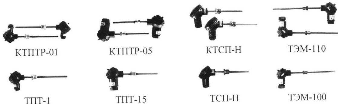
Рисунок 3 – Преобразователи температуры. Общий вид