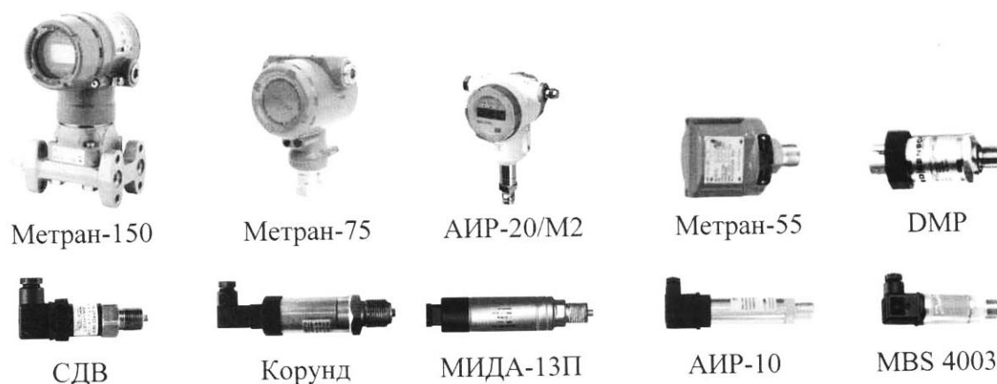
Рисунок 4 – Преобразователи давления. Общий вид