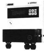
Рисунок 1 – Тепловычислитель СПТ941