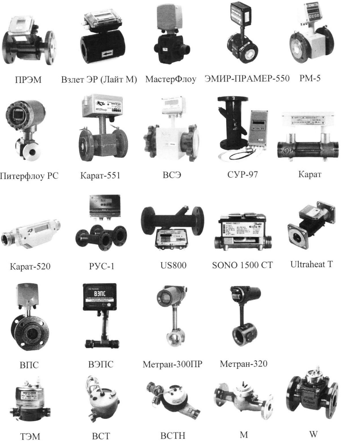
Рисунок 2 – Преобразователи расхода. Общий вид